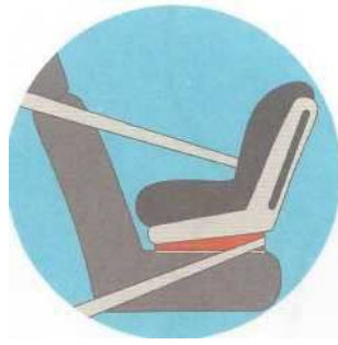
Лицом против движения